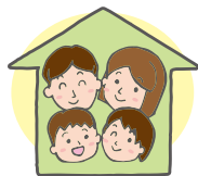
会員本人と登録同居家族

フレンドリーげんきがあっせんするチケット・サービス等 を利用できるのは 会員本人と登録同居家族 です。 利用日現在会員である方が対象になります。 また、同居のご家族に変更が生じた場合は届出(変更届)が 必要です。 ただし、会費未納(滞納)がある場合には会費完納まで利用 できません。