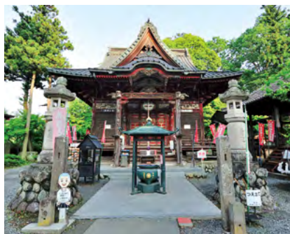
秩父札所1番 誦経山 四萬部寺

秩父札所は、秩父地域の34寺院からなる観音霊場です。1234年に開創され、西国三十三観音、坂東三十三観音と合わせて「日本百観音」に数えられます。2026年3月18日～11月30日の期間は「午歳総開帳」として、普段は見る事ができない御本尊が、34寺院で一斉に御開帳(公開)される貴重な機会です。