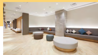
ドック・健診エリア